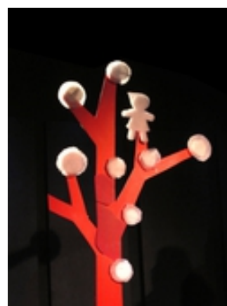
Contes de ma Babouchka

Métro Château de Vincennes ( plus 20 minutes à pied) ou Bus 212 ou 46 arrêt Parc Floral