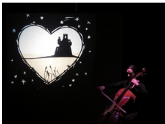
L'homme aux loups

tournée dans le Gers en cours d'organisation